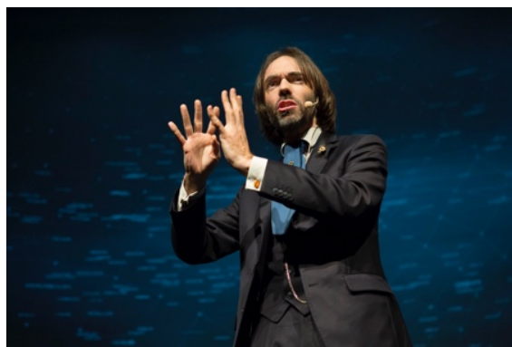
Cédric Villani.