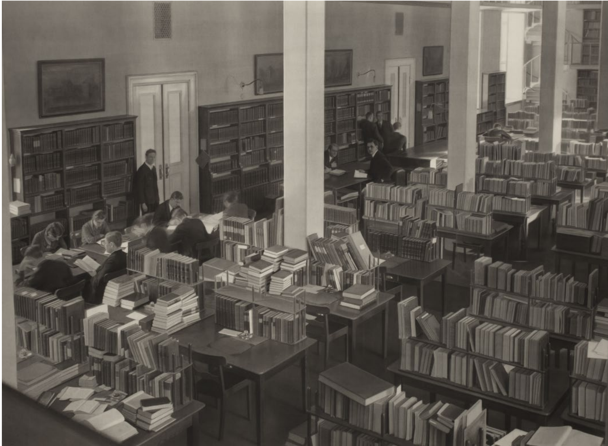
BIBLIOTEKET Malmö konstmuseum