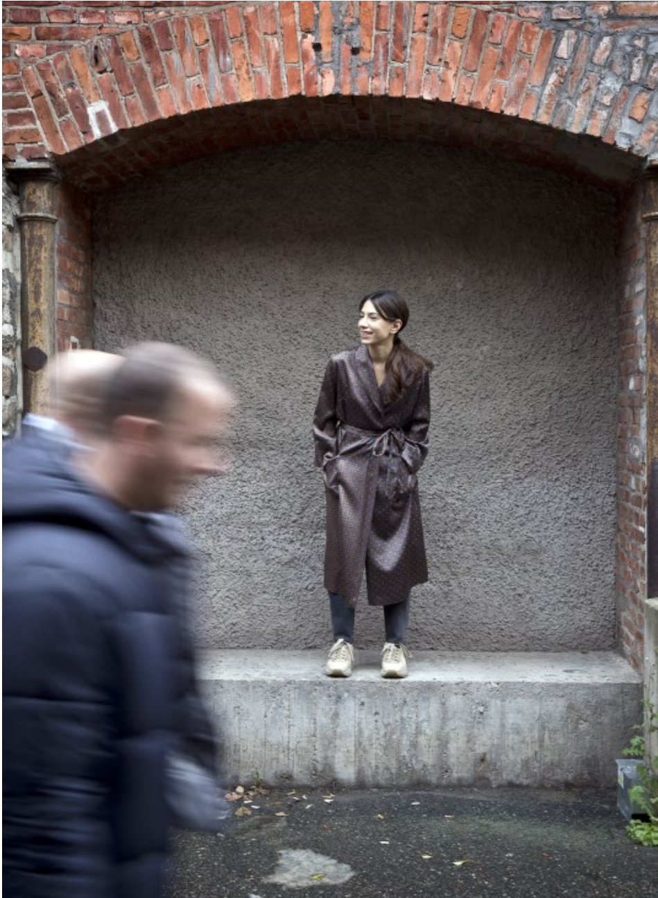
STEN A OLSSONS KULTURSTIPENDIUM 2018

egenföretagare, att du marknadsför och säljer dig själv. Du tackar ja till saker som du egentligen inte vill, för att senare kunna göra det du brinner för. Men när du väl nått dit är du för trött eller splittrad eller har gått in i väggen. Därför känns det fantastiskt att få ett stipendium som syftar till utveckling, som gör det möjligt att få fortsätta att utforska sitt eget konstnärskap, pröva nya vägar. Få tid, framförallt.