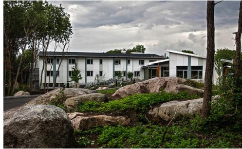
Stenhuset med 1800 m2 för såväl boende som forskning

Idag lever fler än 390 000 personer i Sverige med en sällsynt diagnos. Flera studier visar att de ofta har mer än 40 olika kontakter inom sjukvård och samhällets olika stödfunktioner. Men samtidigt är kunskapen bland de som kan ge stöd ofta begränsad om de särskilda behoven vid sällsynta diagnoser. För att få rätt stöd krävs kunskap.