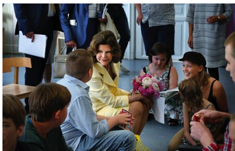
H.M. Drottning Silvia besöker barnkalaset på Ågrenska.