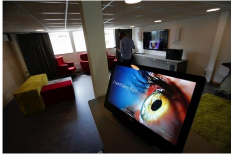
Framtidens rum har virtual reality-utrustning