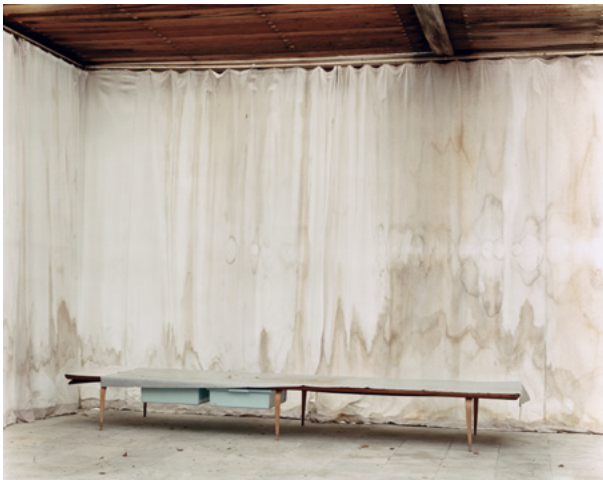
Mikael Olsson / FK03 , 2003