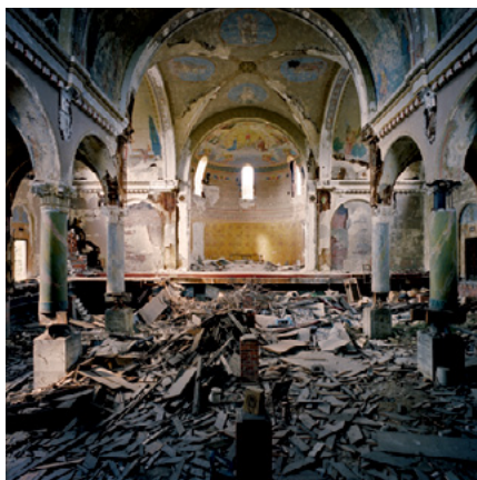
Annika von Hausswolff | Untiteld (Kingdom of heaven) 2011