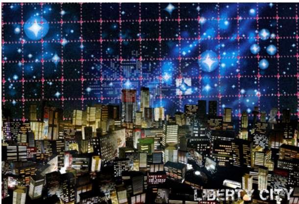
Ola Åstrand / Jag är en hare i ditt stälkastasken (detalj) , 2011