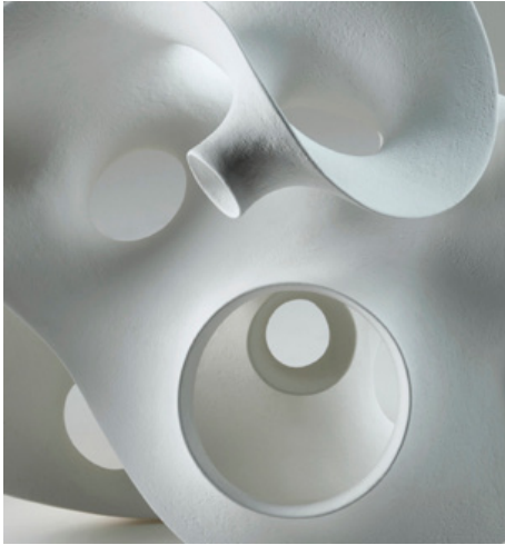
Eva Hild / Splay (detalj) , 2011.